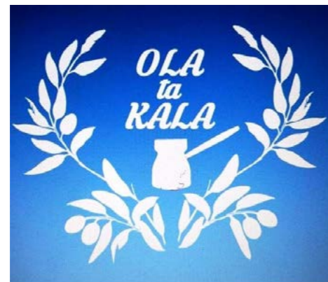
Café Ola ta Kala Kapuzinerstraße 31, 80337 München