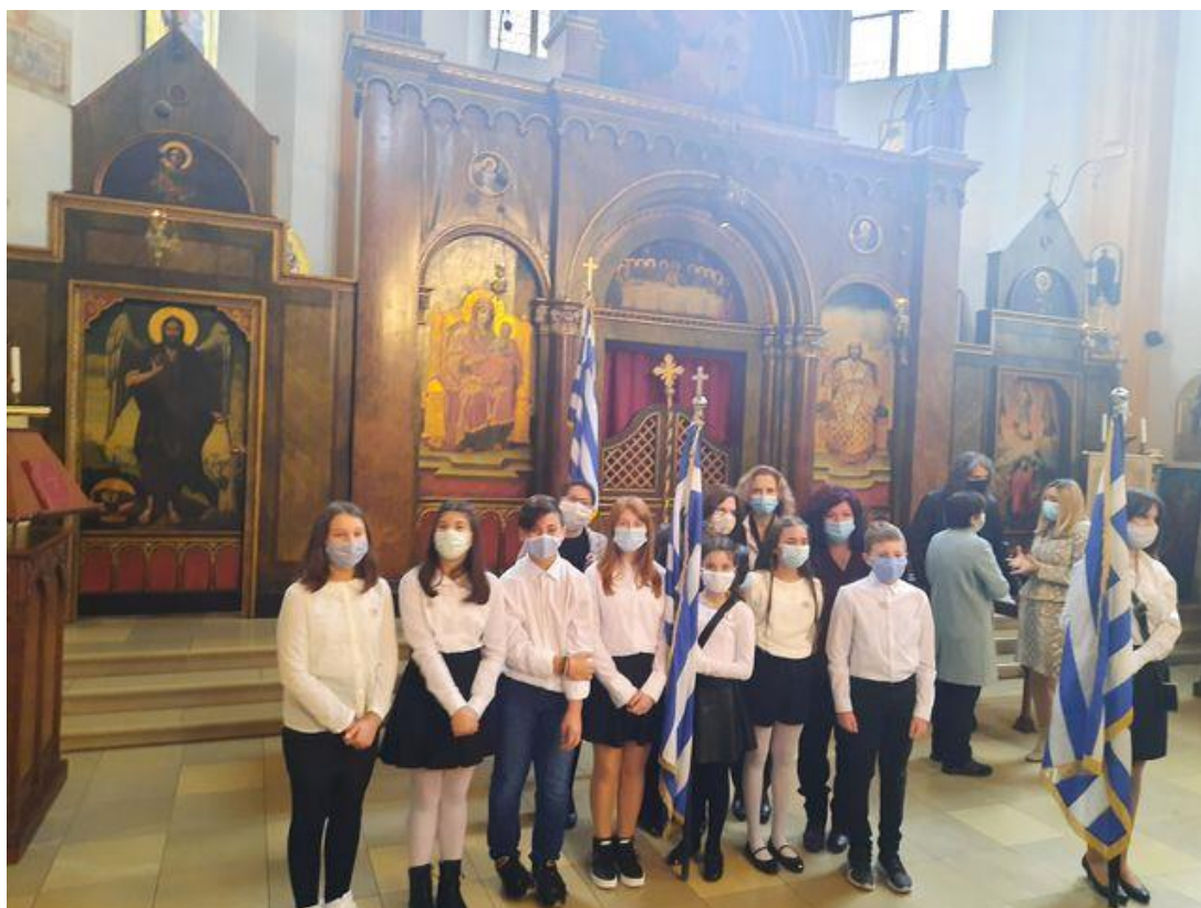
Στην ιστορική Εκκλησία Salvatorkirche στο Μόναχο τελέστηκε δοξολογία για την εθνική επέτειο παρουσία μαθητών του ελληνικού δημοτικού σχολείου "Πυθαγόρας"