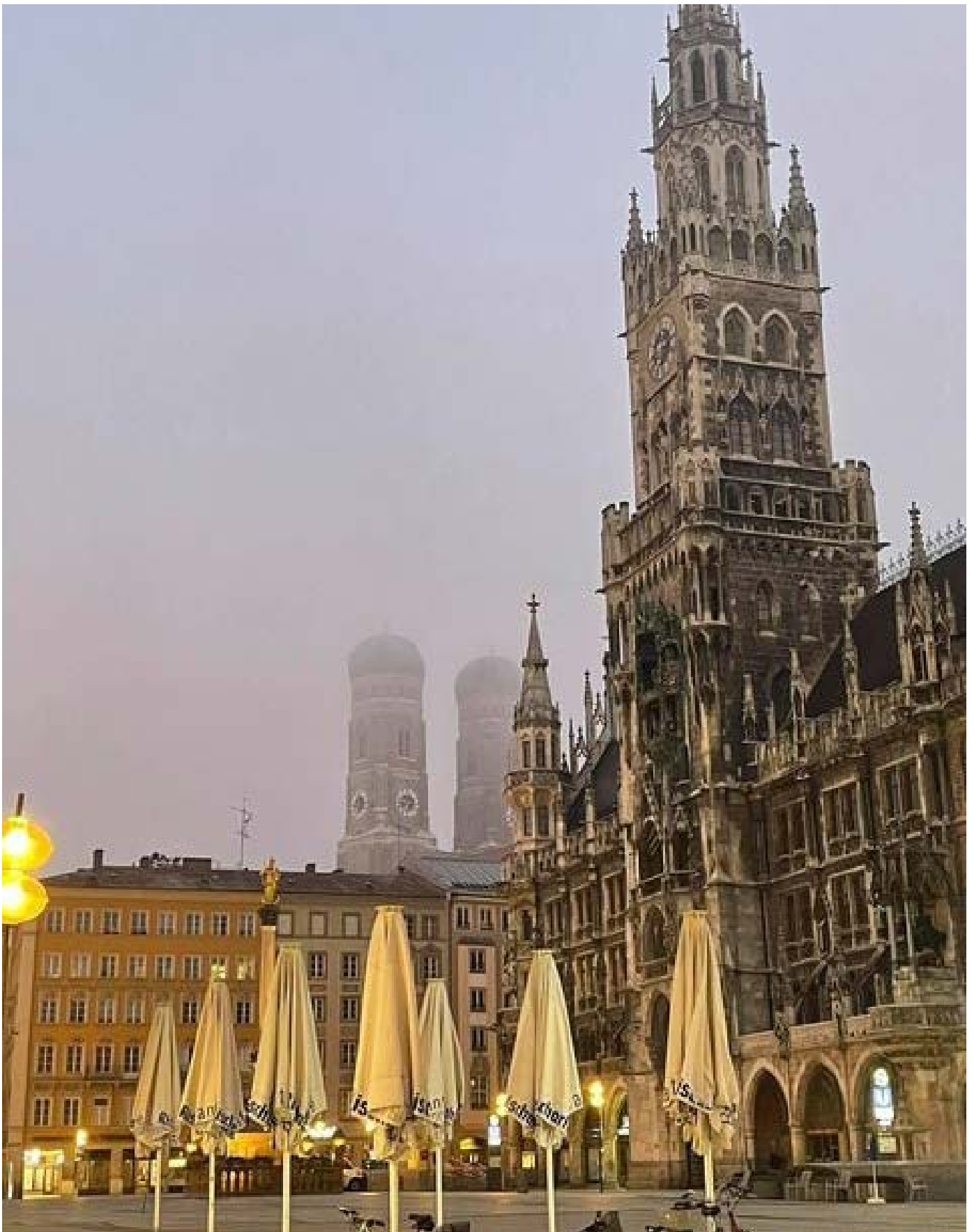
Φωτογραφία του φίλου @Babinos Papadopoulos