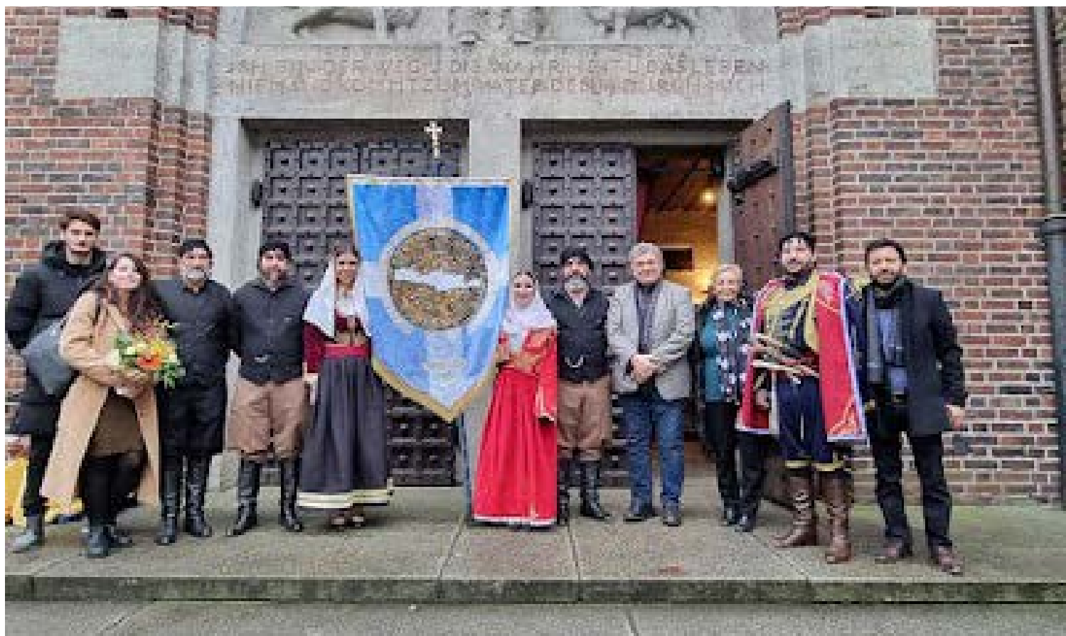
Από την επιμνημόσυνη δέηση για το ολοκαύτωμα της Μονής Αρκαδίου στην Ενορία του Αγ. Γεωργίου Μονάχου (14.11.2021)